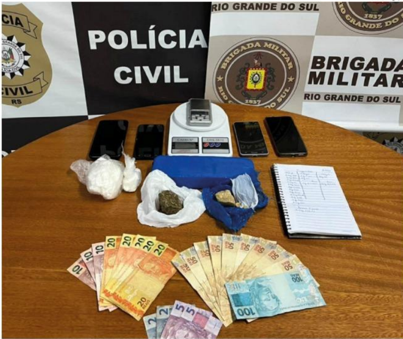
Duas mulheres e um homem são acusados de envolvimento. Drogas e materiais foram localizados em uma casa