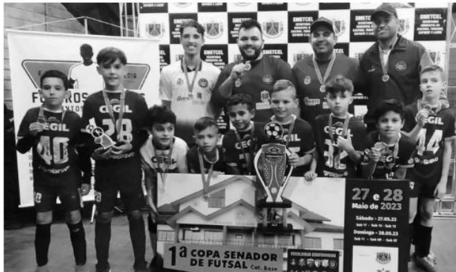
Primeiro título da base do Giruá Futsal veio com a equipe Sub 11

O domingo, dia 28/5, está marcado na história das categorias de base do Giruá Futsal, pela conquista do primeiro título das jovens promessas, com a Sub 11. E ainda teve o atleta destaque da competição.