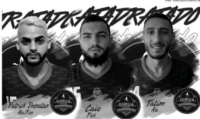
Reforços recentes contratados pelo Giruá Futsal

Junto com Giruá, no grupo A, estão a AGF (Agudo), São José do Inhacorá, AGSL (São Luiz), ANPF (Nova Teópolis), APF (Gentil), BR Futsal (Pelotas), Ibrá Futsal e Penharol (Guaíba).