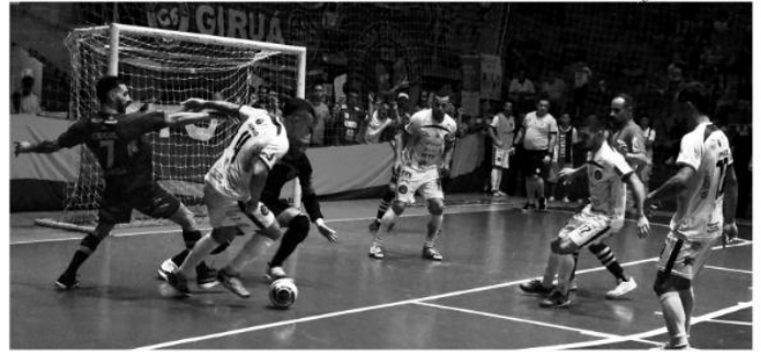
Perdendo, Giruá colocou o goleiro na linha mas levou o 2º gol em contra ataque