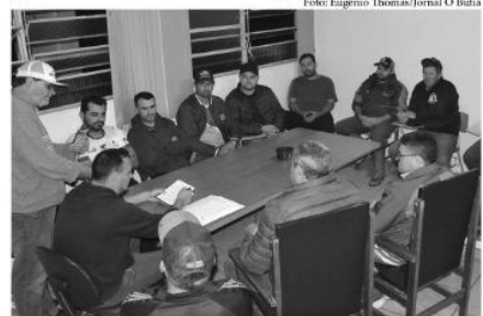
Sorteio dos jogos foi feito na Comud, com representantes das equipes