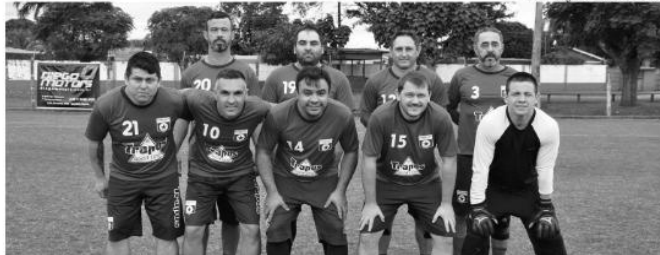
Na partida que abriu a Copa 7, Agrovema (na foto) venceu o Aymoré B de 2 a 0