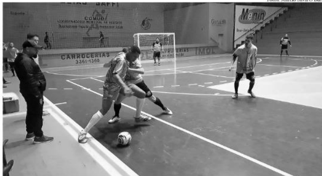
Na partida, deu 8 a 2 para o Giruá contra equipe de Ijuí, nesta quinta

O Giruá Futsal realizou na fria noite desta quinta-feira, dia 11, um jogo-treino preparatório para a disputa da Série B do Gaúcho 2023, contra o Ijuí Fut-