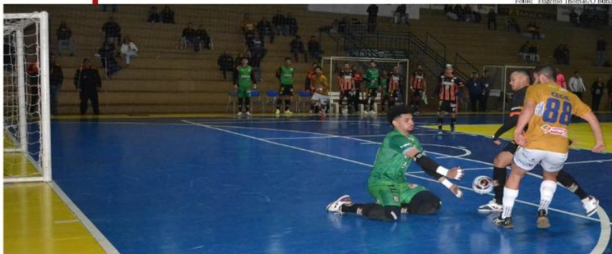
Giruá pressionou, fez dois gols, mas não segurou a vitória contra o Agudo, no último sábado

A partida em Pelotas será transmitida ao vivo, de Pelotas, pela Web Tv Giruá e narração de Marcio Silva, pelo Youtube.