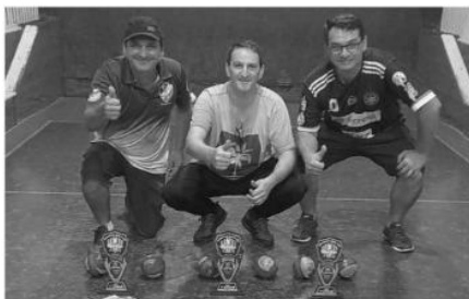
Deloss, Reghelin e Tabor da foram os campeões, após três dias de partida na final

Já no futebol sete, o Paparella/Pollo Automotiva, de Santa Rosa, conquistou o título de campeão do 23º Torneio do Boi ao vencer na decisão o Entre