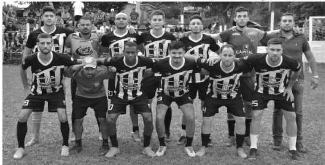
Equipe do Entre Amigos fez ótima campanha e só perdeu na disputa final

Mais uma vez, foi realizada com sucesso a edição 2023 do Torneio do Boi – Futebol Sete e Bocha em Trios, pela Afucegi, no último final de semana e que se estendeu até segunda, 1º de maio, em comemoração ao Dia do Trabalhador, na sede da Associação, em Giruá.