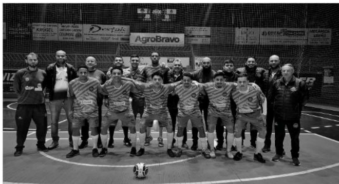
Equipe que iniciou o jogo-treino e prepara-se para estreia no Gaúcho