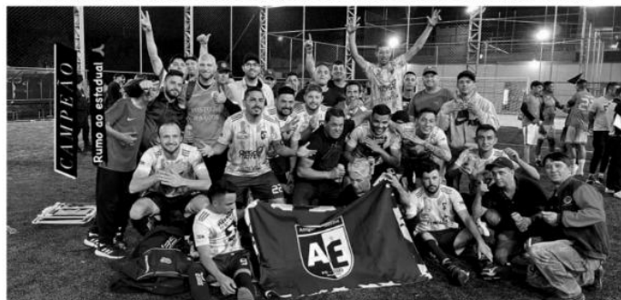
Amigos do Ebinho jogam a tarde contra o Botafogo, de Santo Ângelo