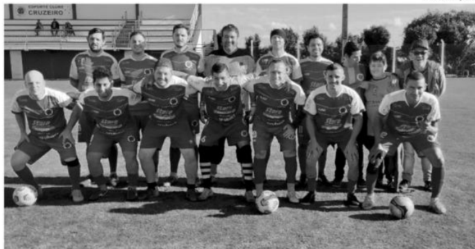
Veteranos do Cruzeiro abrem os jogos pela manhã contra o Guarani, no Estrelão