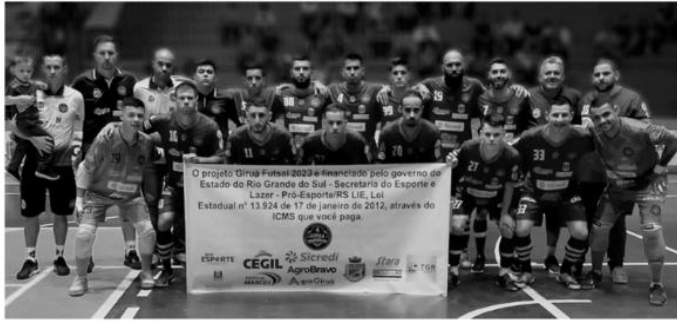
Em casa, vitória do Giruá veio no tempo normal, mas não deu na prorrogação