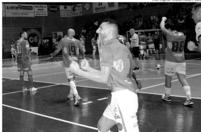
Giruá Futsal tenta manter invencibilidade contra a AGSL, neste sábado

A saída da delegação giruaense será por volta das 15 horas deste sábado, com destino a São Luiz Gonzaga.