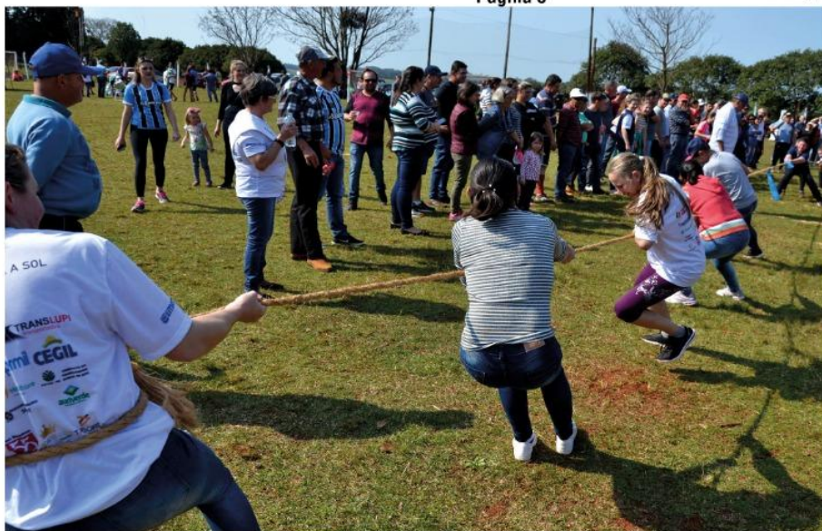
Disputas entre as equipes envolvem a força também das mulheres, nos Jogos Rurais