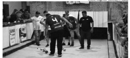
Santa Lúcia venceu na 1ª partida, no CTG, de 2 a 1, e está na final anfitriã e Boca da Picada. Na primeira partida, quarta-feira, deu vitória da Boca da Picada.

A outra vaga para a final seria decidida na noite desta sexta, 9, na cancha do bairro Hortêncio, entre a equipe