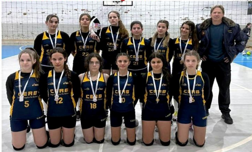
Equipe de voleibol infantil feminino do Cerb trouxe o bicampeonato entre as melhores da região

co do Cerb, "é um evento único, que reúne as melhores equipes de volei-