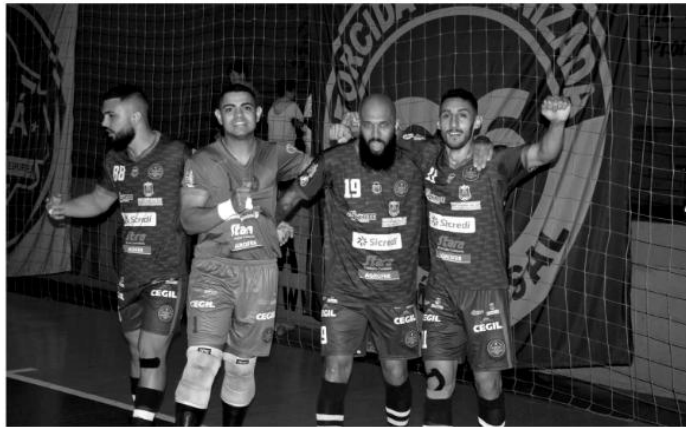
Com apoio do torcedor, os "tiros" do Giruá Futsal devem vencer o BR neste sábado

O Giruá Futsal treinou, se preparou, viajou, entrou em quadra, teve um início de partida, pouco mais de 1 minuto, mas o jogo não seguiu. A arbitragem viu que o risco à integridade física dos atletas, era grande e iminente, suspendeu