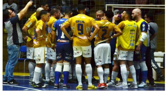
Técnico Canca está ajustando a equipe e melhorando o desempenho do Giruá Futsal

No último sábado, 1º, no Ginásio Elias Saffi, veio a primeira vitória