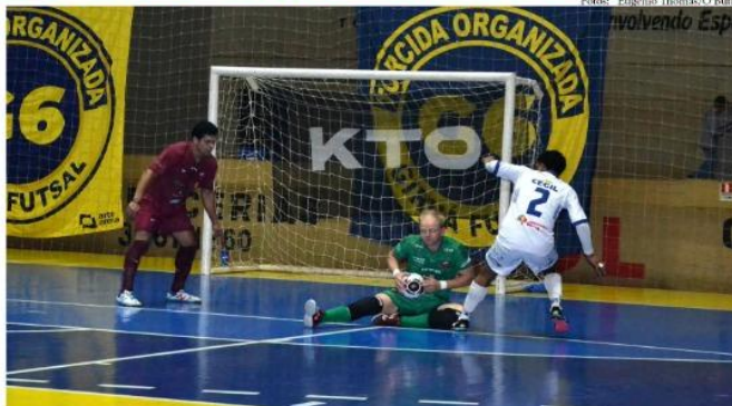
Pressão deve ser total, inclusive da torcida, para o Giruá Futsal vencer o líder da chave, neste sábado

Com apenas 1 ponto em 9 disputados – duas partidas fora e uma em casa, o Giruá Futsal precisa vencer a equipe da AAGF, da cidade de Agudo, na noite deste sábado, 17, no Ginásio Elias Saffi, às 20 horas, para seguir com motivação e ganhar mais confiança na disputa do Gauchão de Futsal Série B 2023.