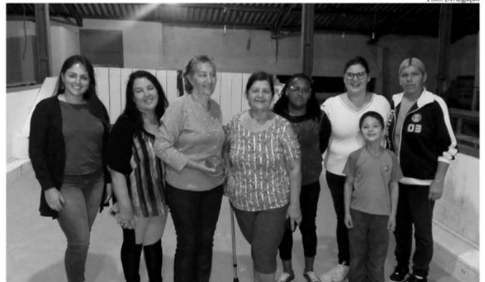
Também na bocha, elas estão onde elas quiserem, agora nas canchas