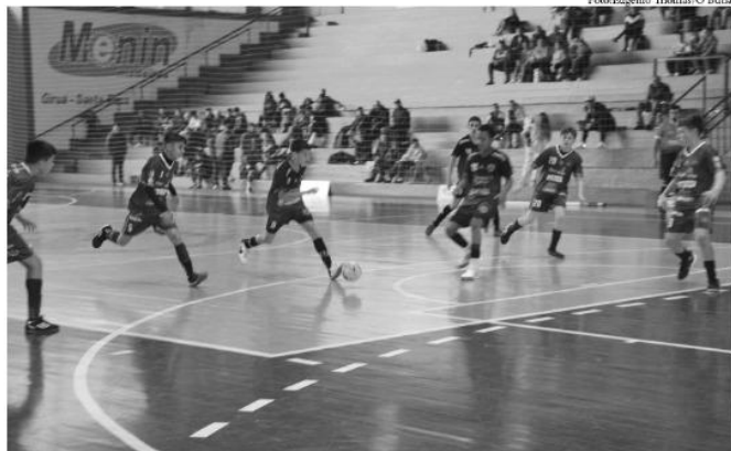
Garotos do Sub-13 se esforçaram mas não resistiram ao bom futsal do Master

No último domingo, dia 11, o Ginásio Elias Saffi sediou a rodada da Liga Noroeste de Futsal das categorias de base, Sub 13 e Sub 15, com seis representantes de suas cidades, onde o Giruá Futsal atuou nas duas categorias - Sub