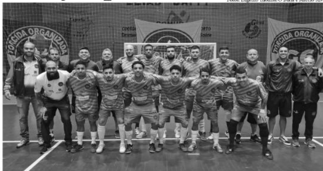
Grupo que esteve em quadra nesta quinta a noite, em jogo-treino no Ginásio